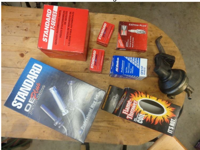
Kartonger till allt som bytts+den gamla soppapumpen