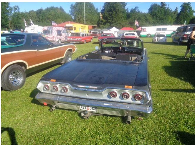
Chevan från Tidaholm som drog in oss

"If you are a Ragger, you never stand alone".