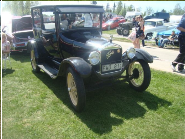
Bild1: Parkerade. Upp med bagageluckor och fram med bord och stolar.